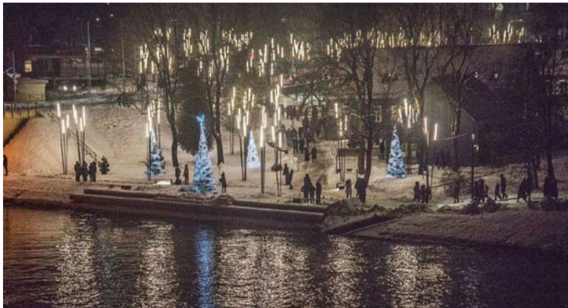
Dėl ryškiai šviečiančių „lazdų“ sankryžoje šalia Tiltų gatvės komplekso savivaldybė sulaukė vairuotojų skundų.

„Anykšta“ domėjosi, kiek vis dar neįveiklinto naujojo komplekso išlaikymui iš savivaldybės biudžeto jau išleista pinigų.