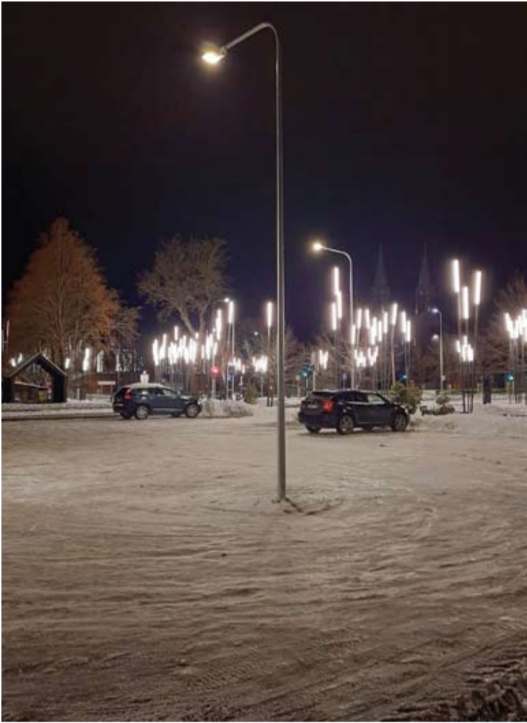
Šalia Anykščių turizmo ir verslo informacijos centro esančios automobilių stovėjimo aikštelės viduryje įrengtas apšvietimo stulpas automobilių vairuotojams tapo tikru galvos skausmu.