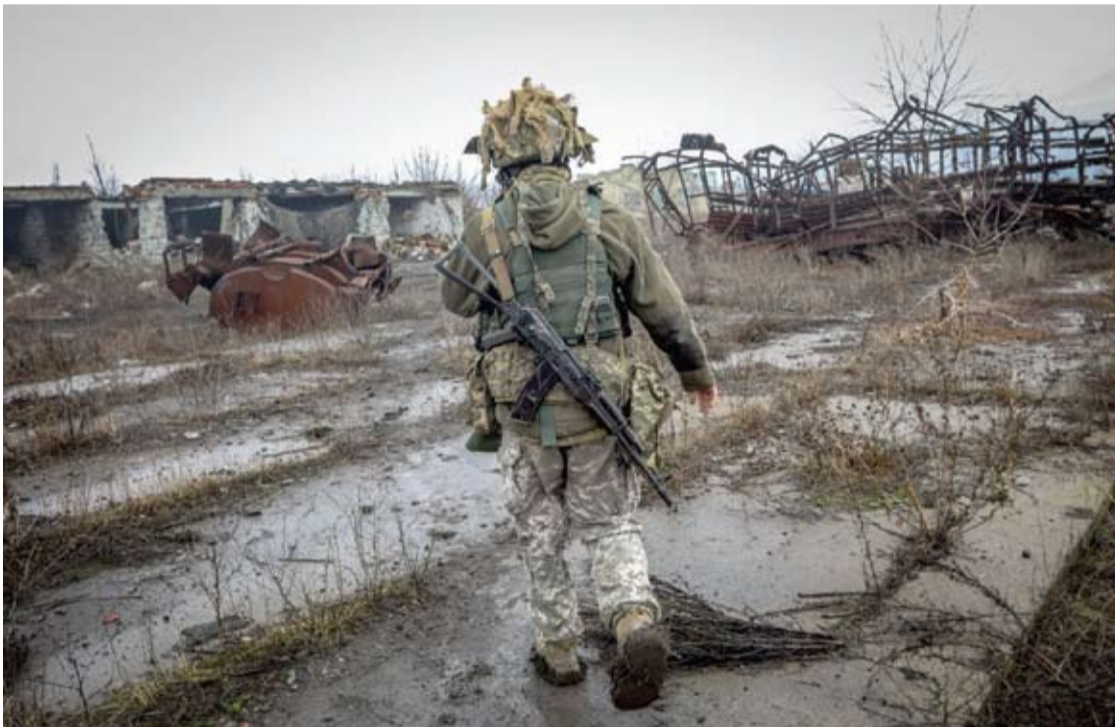
Daugelis ukrainiečių nė už ką nenori palikti gimtinės ir mūru stoja ją ginti.