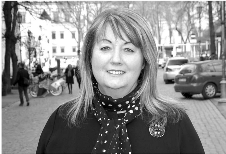
Vilija Blinkevičiūtė: „Neabejoju, kad sankcijos pajus ir Rusijos oligarchai, ir tie, kurie įsako bombarduoti Ukrainos žmones.“

- Tai atsakas į taikios valstybės užpuolimą. Tai vienas iš būdų paveikti agresorių ekonominėmis, finansinėmis priemonėmis, apriboti jo ga-